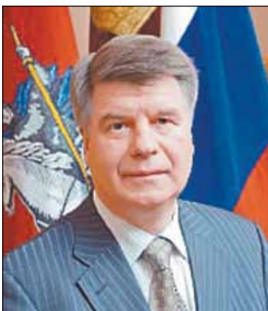
Уважаемые жители района Левобережный! Начало сентября знаменуется собой два важных для нас

По традиции в первые выходные сентября москвичи отмечают День города. В этом году Первопрестольной исполняется 865 лет.